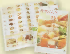
注文カタログ「元気くん」

野菜・果物、米、肉、魚介類、調味料、加工食品、日用品まで、安全性にこだわった商品をラインアップ。カタログ「元気くん」から自由にご注文いただけます。